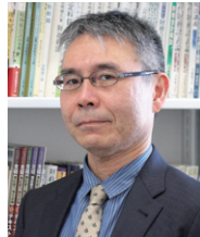
専攻主任 教授・博士(法学)・公認会計士・税理士

企業活動や企業会計の国際化に伴い、これからの職業人に求められる能力は学士教育だけでは対応しきれないほど年々高度化しています。経営学専攻博士前期課程では、学士課程で修得した専門知識のさらなる強化と同時に、高度な実務能力の修得をめざしています。特長は、学界・官界・実業界で長年活躍してきた教員陣が教育指導を行うことと、学生のニーズにきめ細やかに応えるために、5つのコースを設置していることです。